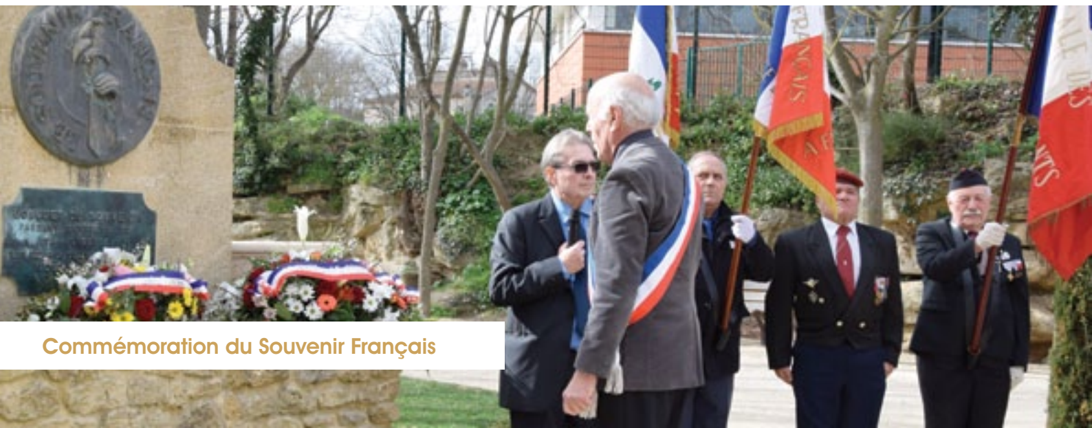
Commémoration du Souvenir Français