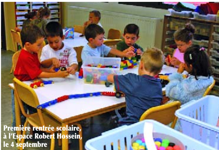
Première rentrée scolaire, à l'Espace Robert Hossein, le 4 septembre