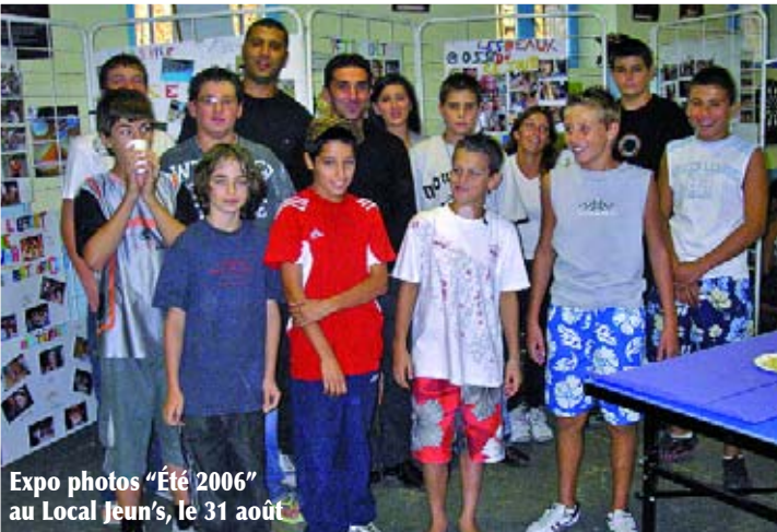
Expo photos "Été 2006" au Local Jeun's, le 31 août