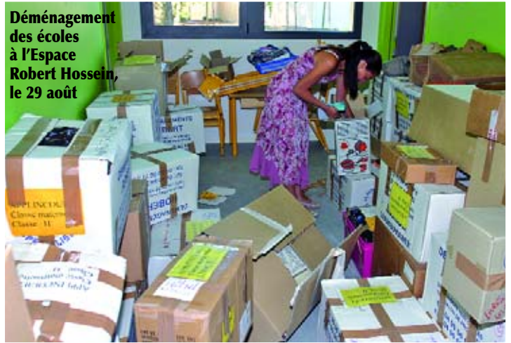
Déménagement des écoles à l'Espace Robert Hossein, le 29 août