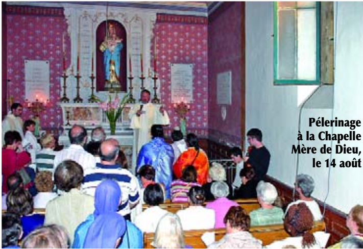
Pèlerinage à la Chapelle Mère de Dieu, le 14 août