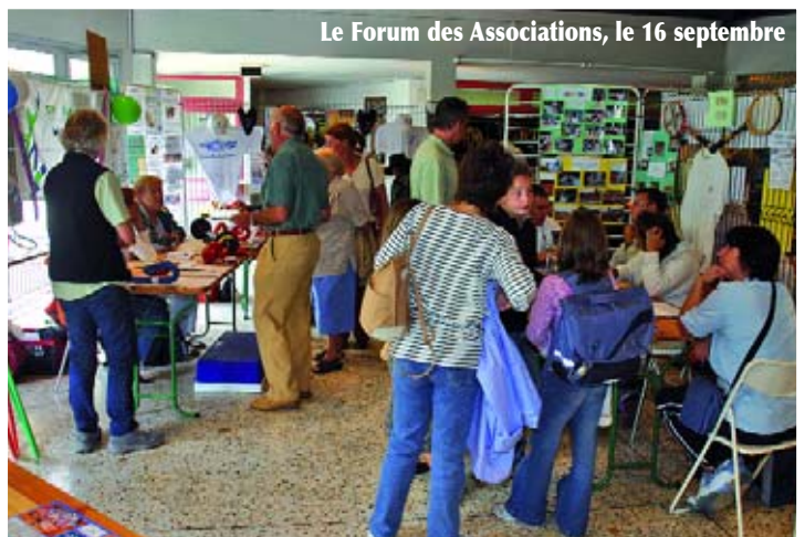
Le Forum des Associations, le 16 septembre