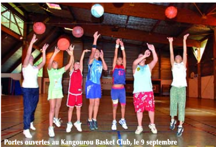
Portes ouvertes au Kangourou Basket Club, le 9 septembre