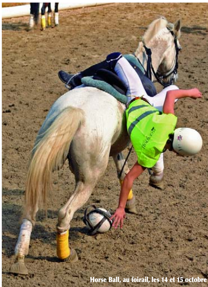
Horse Ball, au foirail, les 14 et 15 octobre