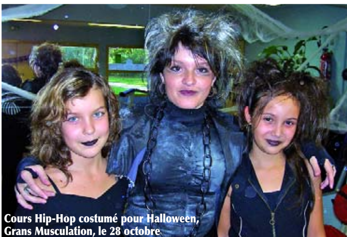
Cours Hip-Hop costumé pour Halloween, Grans Musculation, le 28 octobre