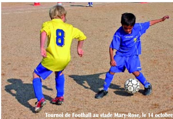
Tournoi de Football au stade Mary-Rose, le 14 octobre