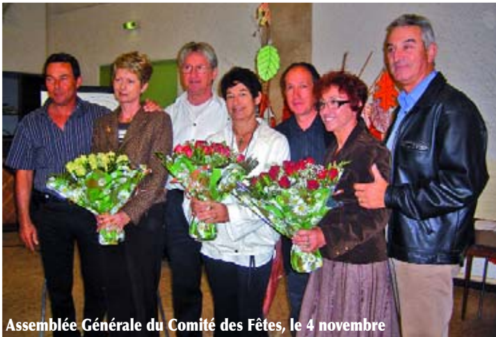
Assemblée Générale du Comité des Fêtes, le 4 novembre