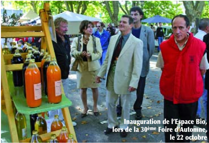
Inauguration de l'Espace Bio, lors de la 30 ème Foire d'Automne, le 22 octobre