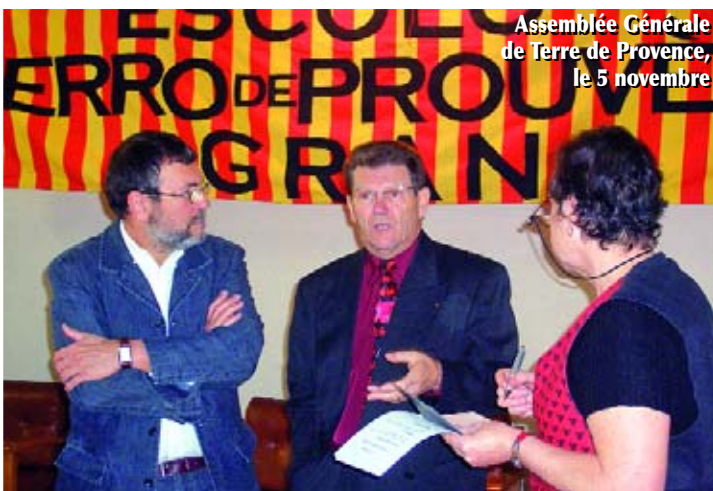
Assemblée Générale de Terre de Provence, le 5 novembre