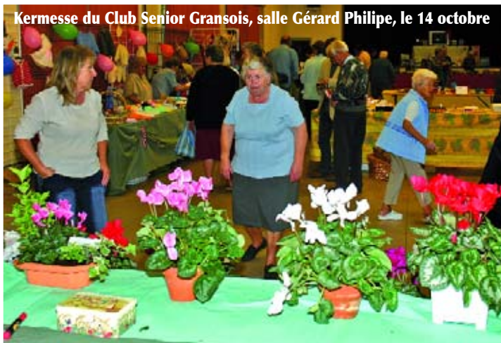
Kermesse du Club Senior Gransois, salle Gérard Philippe, le 14 octobre