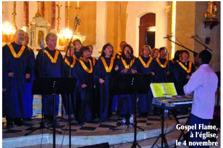
Gospel Flame, à l'église, le 4 novembre