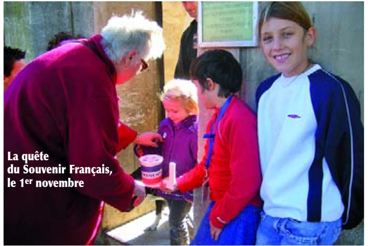
La quête du Souvenir Français, le 1 er novembre