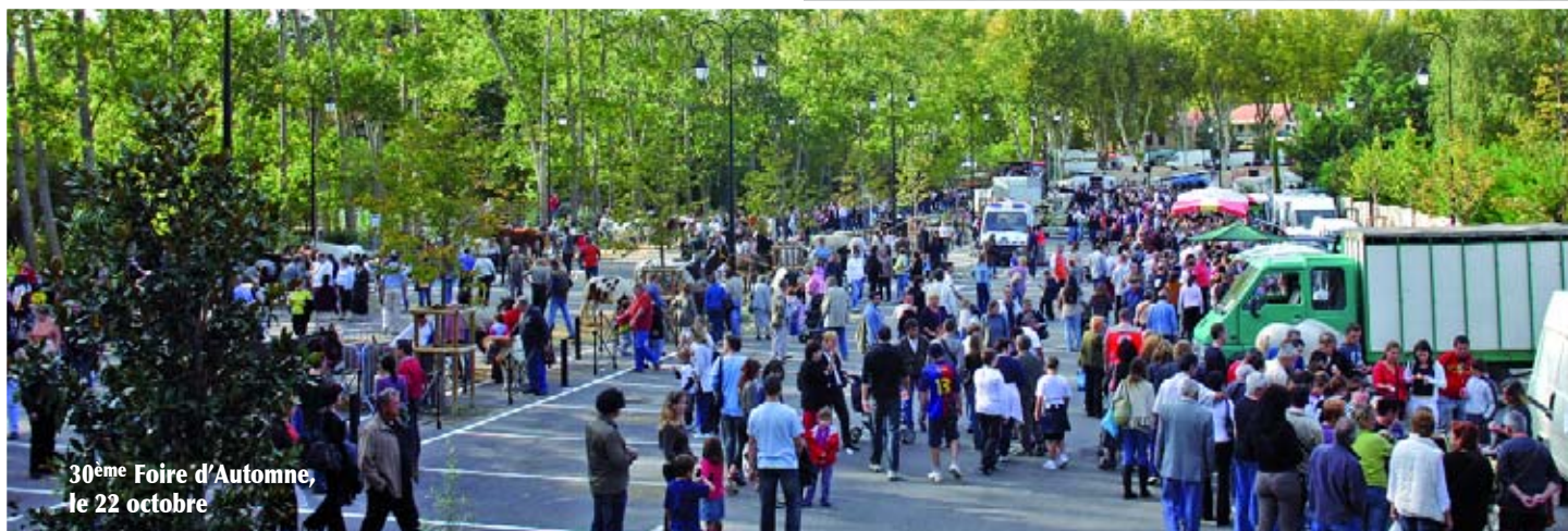
30 ème Foire d'Automne, le 22 octobre