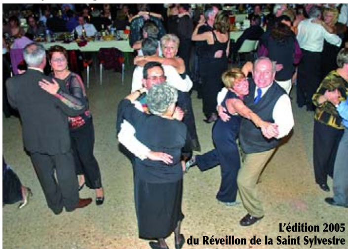
L'édition 2005 du Réveillon de la Saint Sylvestre

Réveillon de la Saint Sylvestre avec cotillons et une animation dynamique des quatre membres de l' orchestre Willy Marco bien connu par les associations Gransoises. La vente des billets se fera à partir du 4 décembre à la boulangerie Bannette "Le Gibassier".