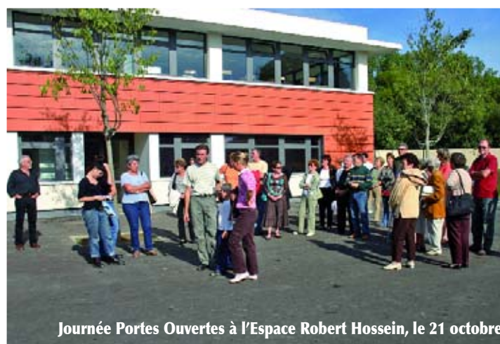
Journée Portes Ouvertes à l'Espace Robert Hossein, le 21 octobre