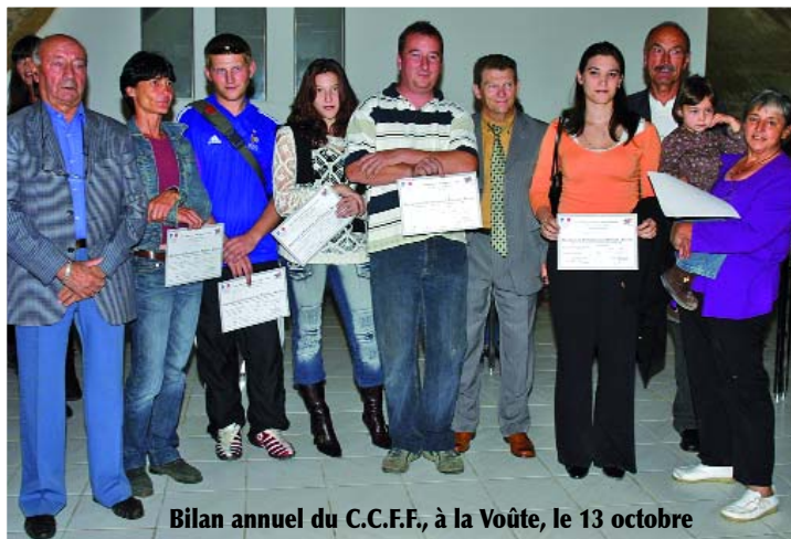
Bilan annuel du C.C.F.F., à la Voûte, le 13 octobre