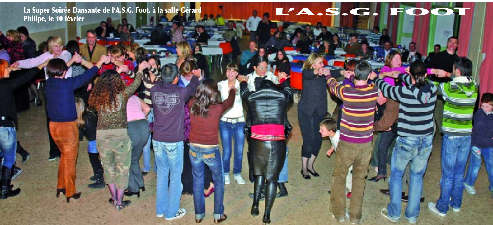
La Super Soirée Dansante de l'A.S.G. Foot, à la salle Gérard Philippe, le 10 février