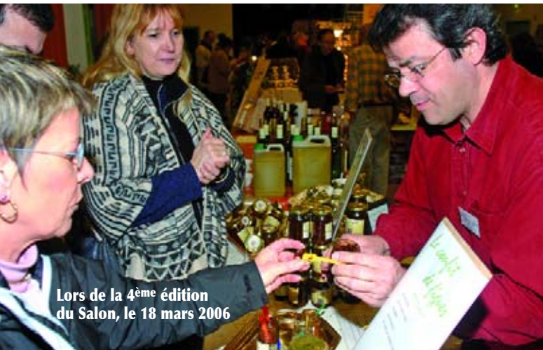
Lors de la 4 ème édition du Salon, le 18 mars 2006

- Afin d'en simplifier la gestion et de permettre à un plus grand nombre de visiteurs d'en profiter.