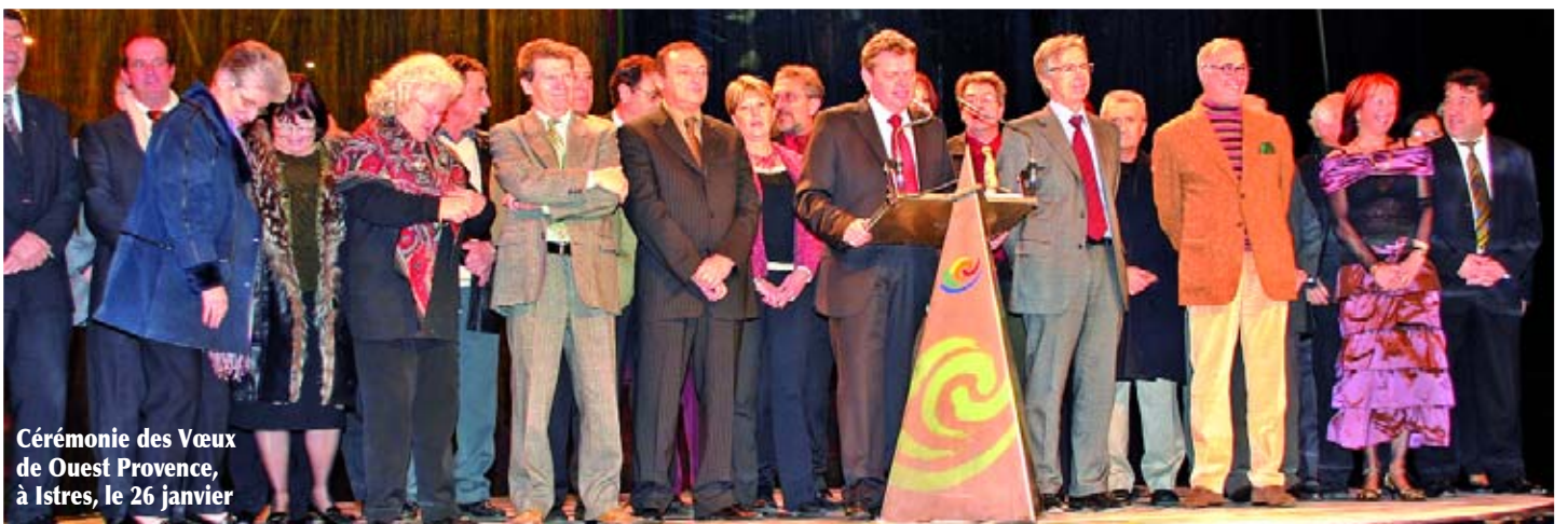
Cérémonie des Vœux de Ouest Provence, à Istres, le 26 janvier