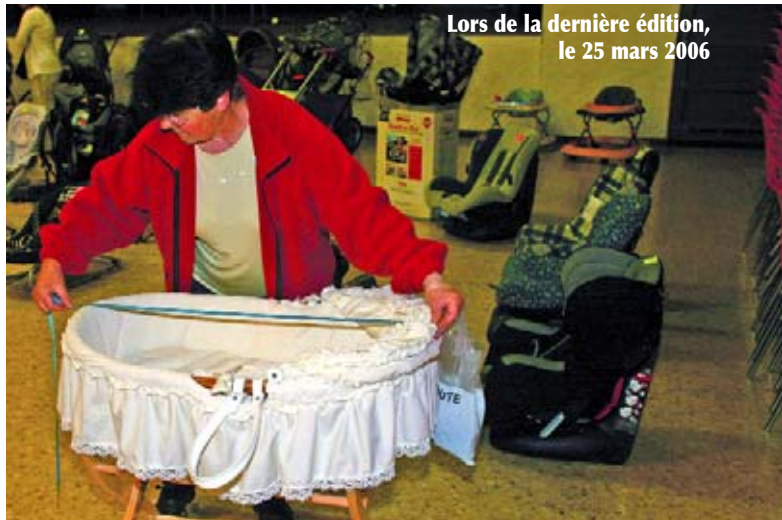
Lors de la dernière édition, le 25 mars 2006

Comme chaque année, l'association "Li Pichounet", organise une Bourse à la Puériculture qui aide les familles à acheter tous objets de puériculture, mobilier, jeux, ..., à des prix très raisonnables ou encore à vendre une partie de ses biens, devenus inutiles pour des enfants devenus grands.