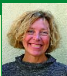
par Christine CALLIGARIS Médecin Homéopathe