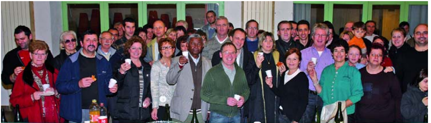
La Galette des Rois des Relayers de Grans qui avaient invité, pour l'occasion, les bénévoles du Téléthon 2006, à la salle Gérard Philippe, le 16 janvier