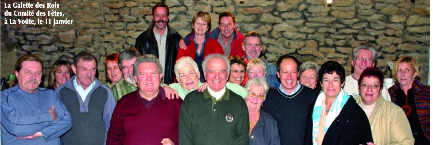
La Galette des Rois du Comité des Fêtes, à La Voûte, le 11 janvier