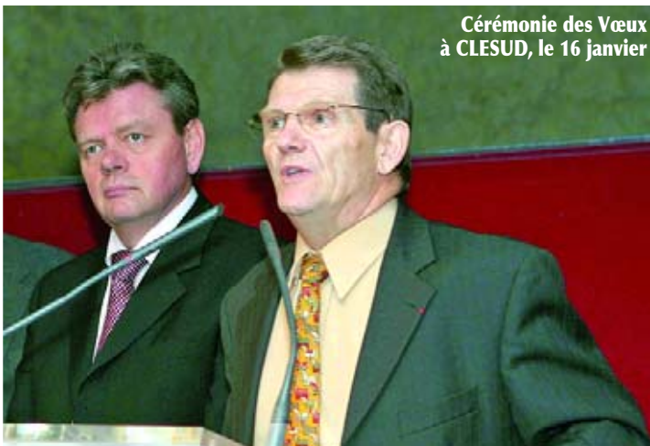
Cérémonie des Vœux à CLESUD, le 16 janvier