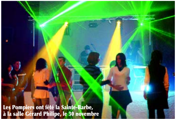
Les Pompiers ont fêté la Sainte-Barbe, à la salle Gérard Philippe, le 30 novembre