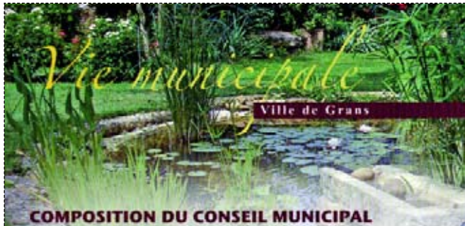
COMPOSITION DU CONSEIL MUNICIPAL

Veuillez encore nous excuser pour cette omission et recevoir nos meilleurs vœux pour cette nouvelle année 2008.