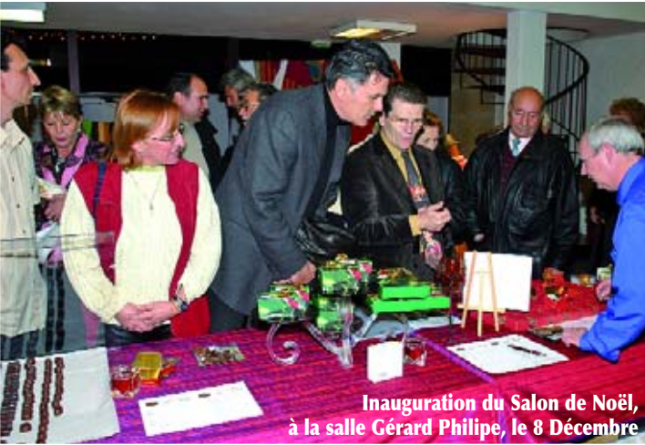
Inauguration du Salon de Noël, à la salle Gérard Philippe, le 8 Décembre