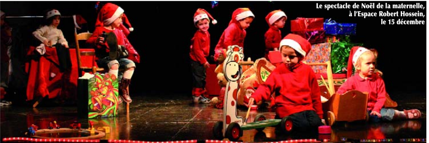
Le spectacle de Noël de la maternelle, à l'Espace Robert Hossein, le 15 décembre