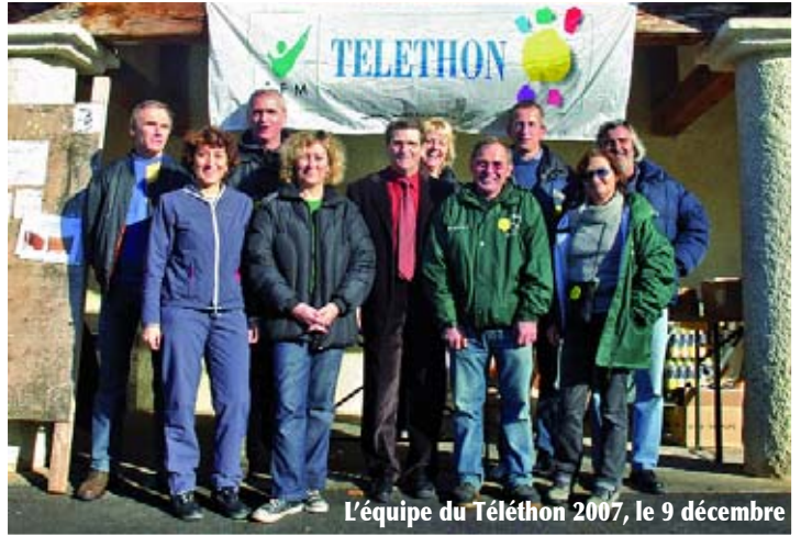
L'équipe du Téléthon 2007, le 9 décembre