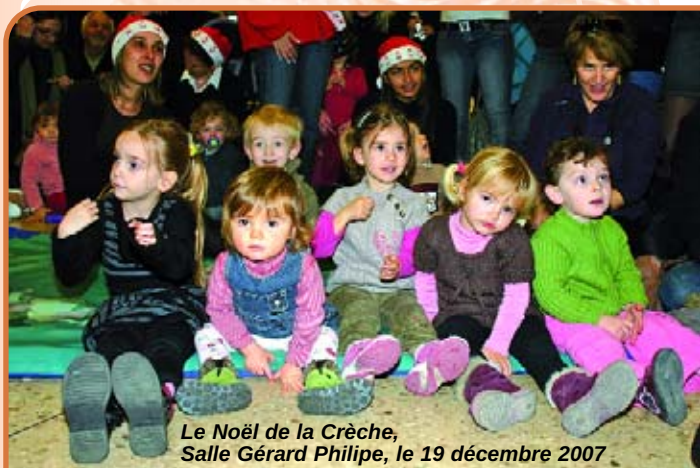
Le Noël de la Crèche, Salle Gérard Philippe, le 19 décembre 2007