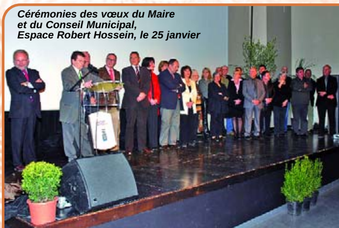
Cérémonies des vœux du Maire et du Conseil Municipal, Espace Robert Hossein, le 25 janvier