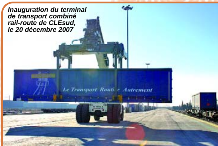
Inauguration du terminal de transport combiné rail-route de CLEsud, le 20 décembre 2007