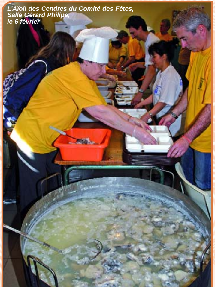
L'Aïoli des Cendres du Comité des Fêtes, Salle Gérard Philipe, le 6 février