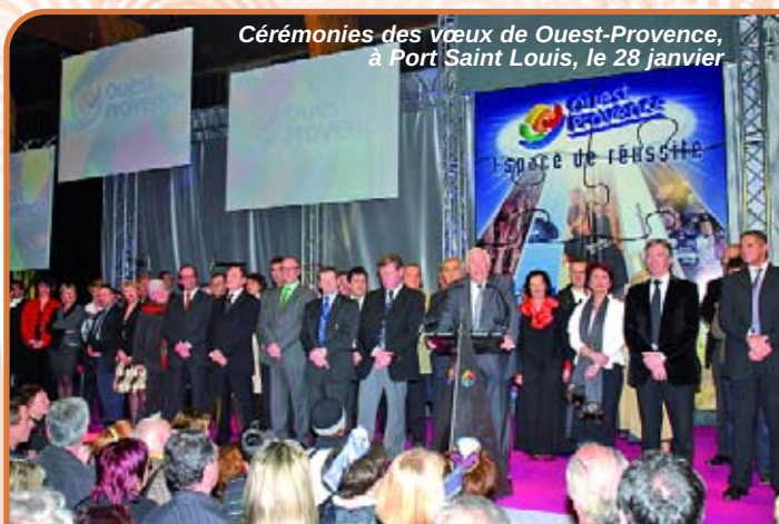
Cérémonies des vœux de Ouest-Provence, à Port Saint Louis, le 28 janvier