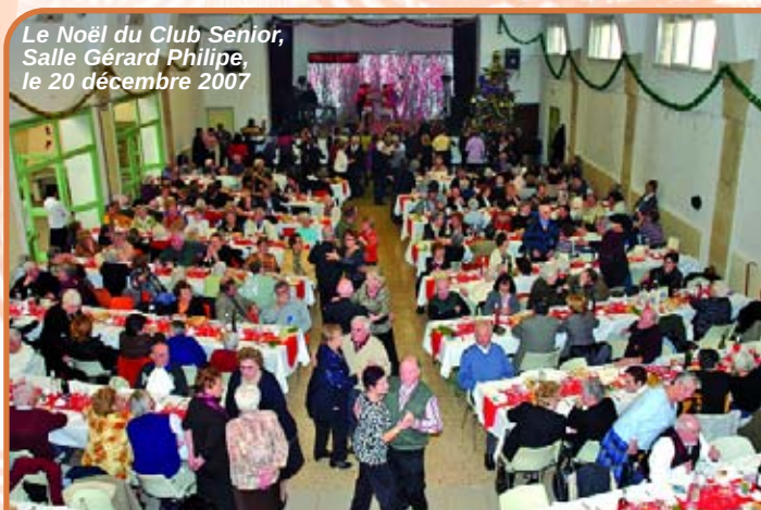
Le Noël du Club Senior, Salle Gérard Philippe, le 20 décembre 2007