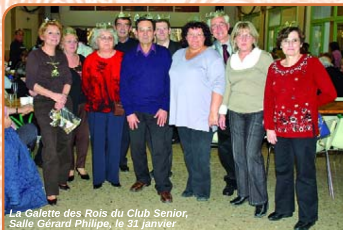
La Galette des Rois du Club Senior, Salle Gérard Philippe, le 31 janvier