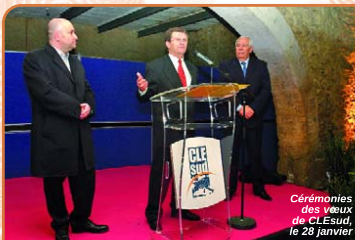
Cérémonies des vœux de CLEsud, le 28 janvier