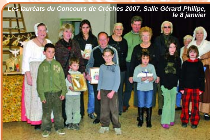
Les lauréats du Concours de Crèches 2007, Salle Gérard Philippe, le 8 janvier