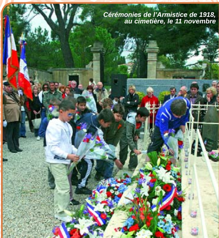
Cérémonies de l'Armistice de 1918, au cimetière, le 11 novembre