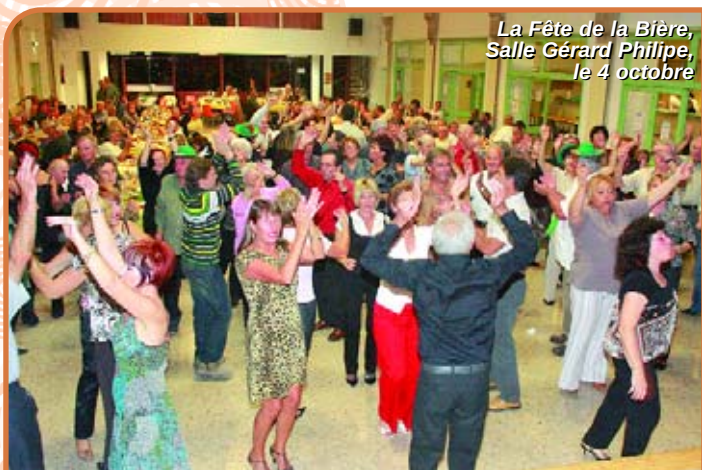
La Fête de la Bière, Salle Gérard Philippe, le 4 octobre