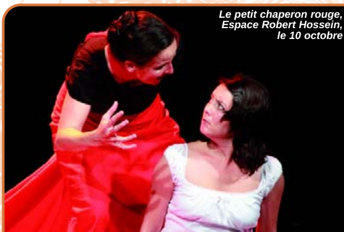
Le petit chaperon rouge, Espace Robert Hossein, le 10 octobre