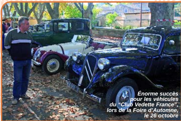
Énorme succès pour les véhicules du "Club Vedette France", lors de la Foire d'Automne, le 26 octobre