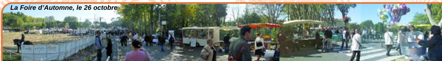
La Foire d'Automne, le 26 octobre