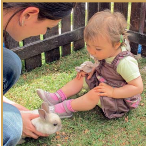
→ Ferme pédagogique à la crèche "Les Feuillantines" le 11 juin