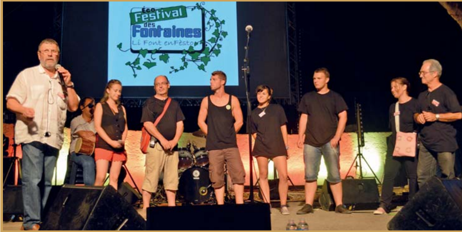
4 ème Festival des Fontaines "l'équipe du festival" parc de la Fontaine Mary-Rose le 4 août