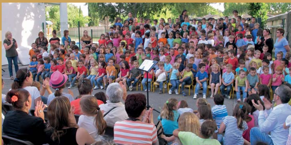
← Chorale de l'école maternelle Jacques Prévert le 7 juin