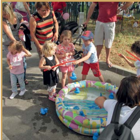
Kermesse de fin d'année de l'école maternelle Jacques Prévert le 28 juin Fête de fin d'année de la crèche "Les Feuillantines" le 5 juillet