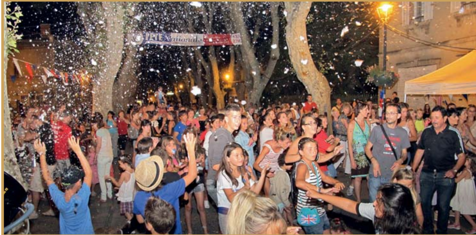
Fête Nationale boulevard Victor Jauffret le 13 juillet