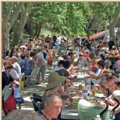
Fête votive Parc de la Fontaine Mary-Rose le 23 juin Fête votive Parc de la Fontaine Mary-Rose le 23 juin