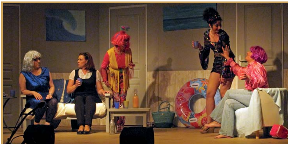
→ "1 er Festival de théâtre amateur" de la Troupe de la Fontaine salle Gérard Philippe le 2 juin