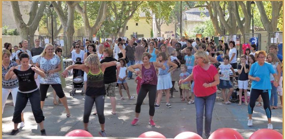
Le Vide-grenier "Spécial jeunes" place de la Liberté le 6 septembre