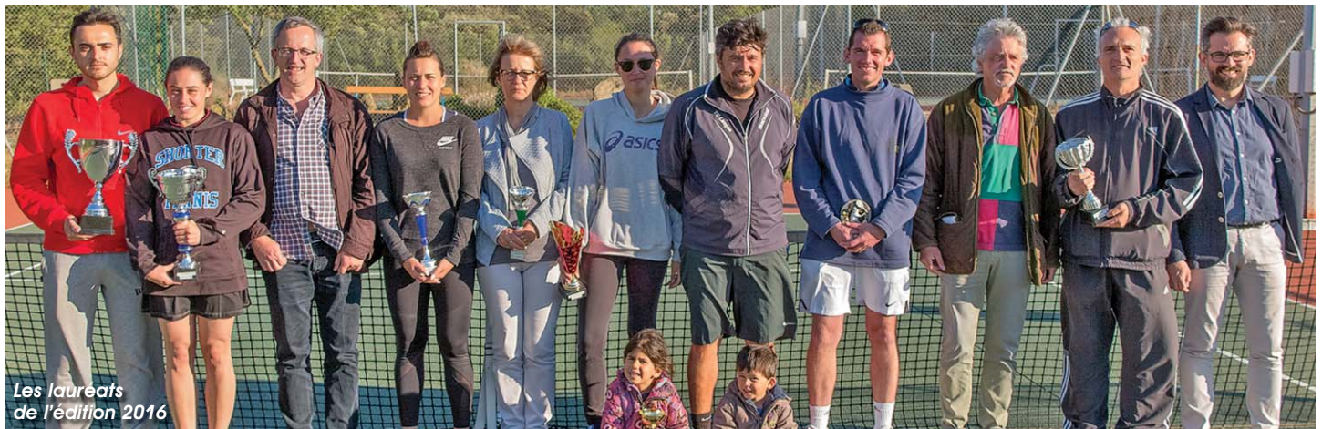
Les lauréats de l'édition 2016

Les derniers carrés auront lieu le samedi 13 mai. « À l'issue des épreuves, nous connaissons les qualifiés pour les finales du dimanche 14 mai ». Venez nombreux encourager les sportifs sur le "central gransois" ! ■