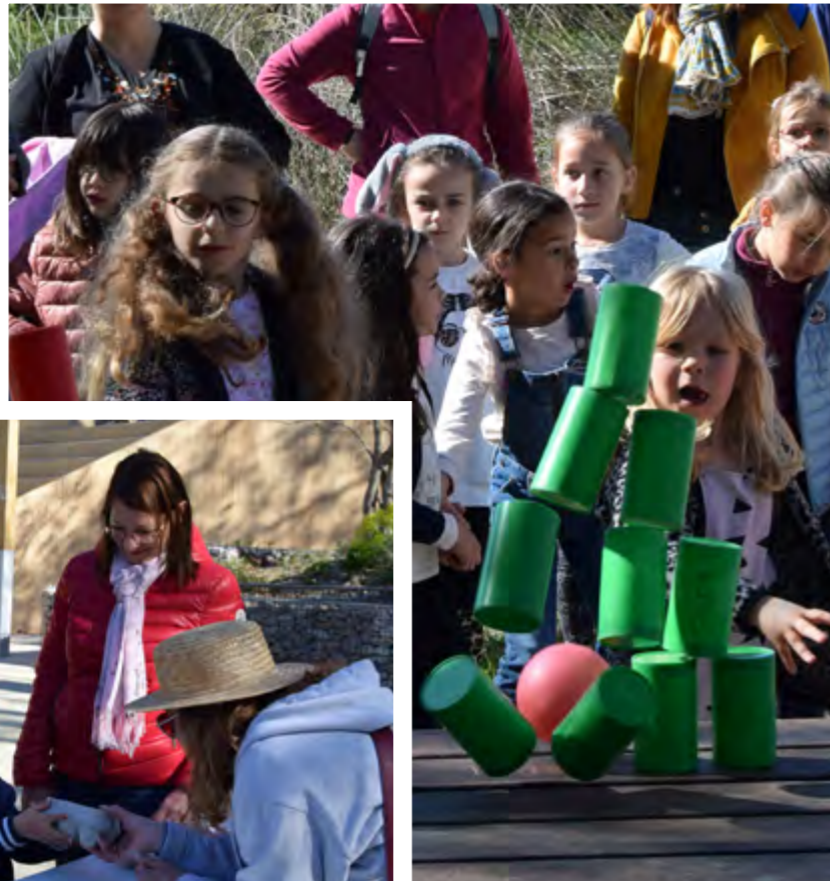
(4) La chasse aux œufs du 8 avril