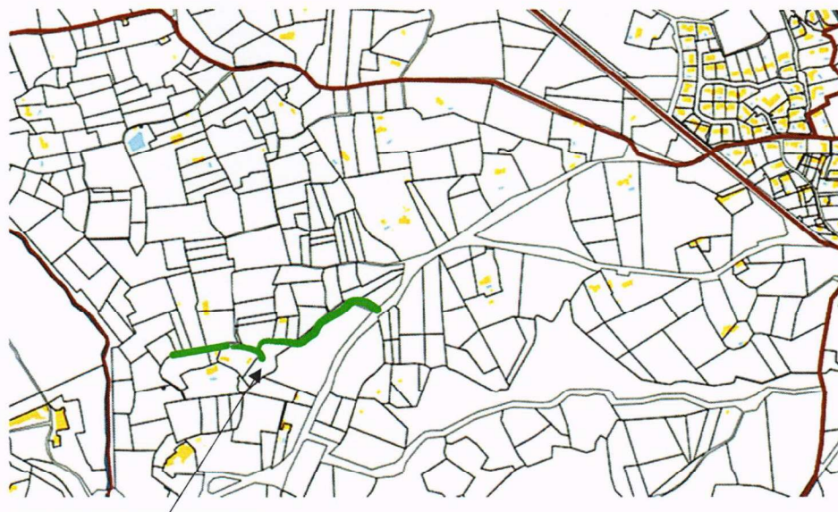
Chemin des Grenadiers

Le Conseil Municipal, à l'unanimité, l'exposé de Monsieur le Maire entendu,