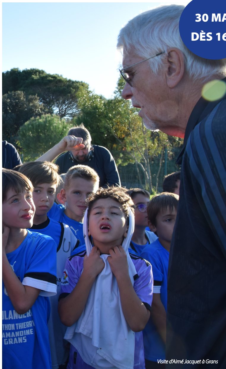
Visite d'Aimé Jacquet à Grans