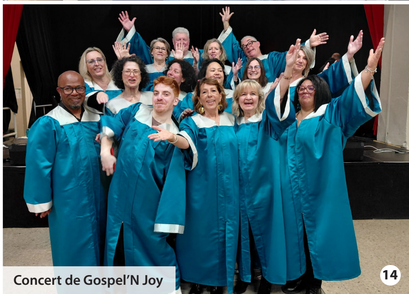
Concert de Gospel'N Joy