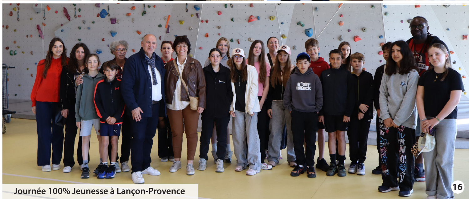
Journée 100% Jeunesse à Lançon-Provence