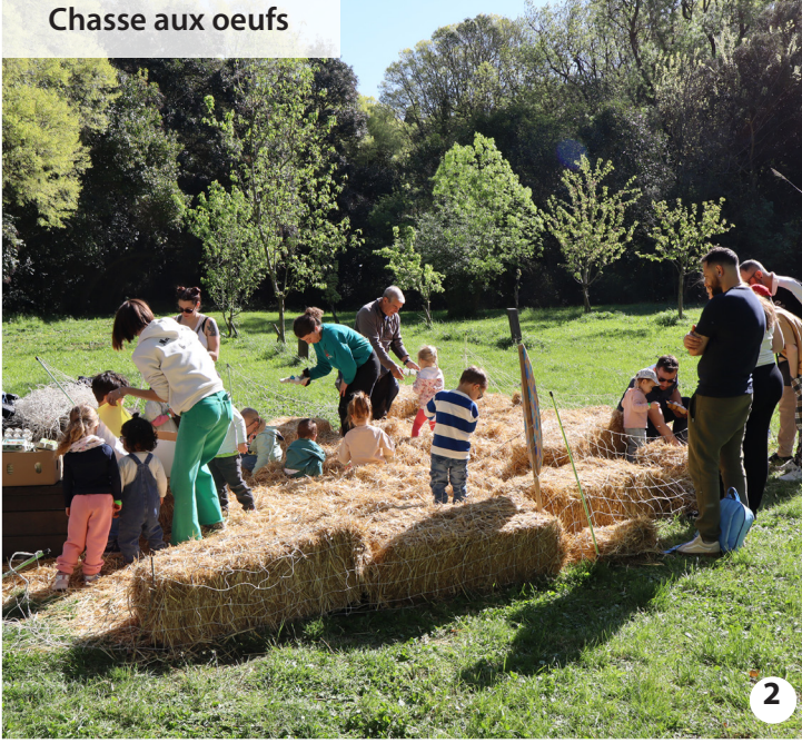
Chasse aux oeufs