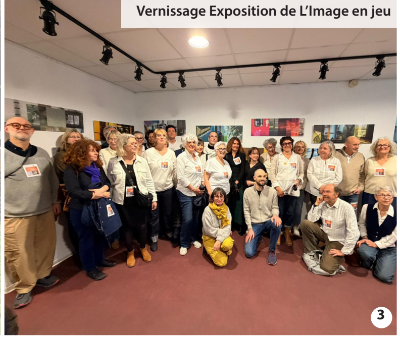
Vernissage Exposition de L'Image en jeu